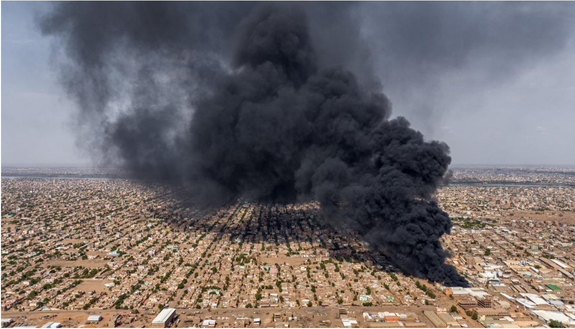
الشكل 3: لقطات من طائرة بدون طيار تظهر حريقا كبيرا في المنطقة الصناعية بأم درمان [24] , 2,461.32, 6753.15