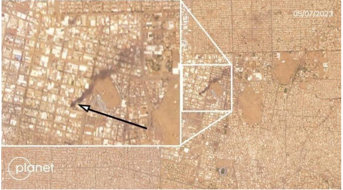
الشكل 2: صور القمر الصناعي للمنطقة الوسطى بأم درمان في 5 يوليو/تموز 2023 [66148.15, 466817.32]

في 3 يوليو/تموز 2023، التقط مشغل طائرة بدون طيار في الخرطوم عمود دخان كبير من حريق قادم من منطقة غرب الثورة، وهي منطقة صناعية تقع شمال سوق أم درمان المركزي (الشكل 3). باستخدام بيانات ناسا فيرمس وجوجل إيرث، تحقق المركز من موقع وتاريخ اللقطات (الشكل 4). تباينت التقارير على وسائل التواصل الاجتماعي حول حقيقة وظيفة المنشأة، وكان الادعاء الأكثر شيوعاً أنه مصنع لمنتجات المواد البلاستيكية .