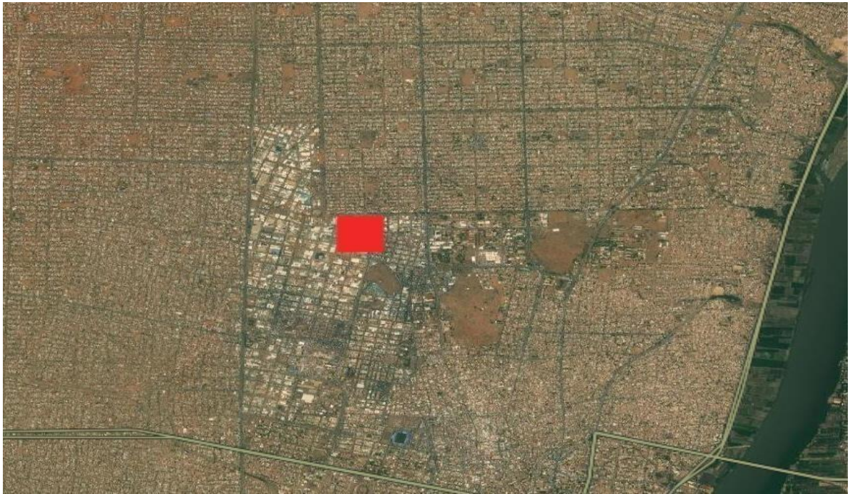
الشكل 4: صور ناسا فيرمس تظهر إشارة حرارية لافته في موقع الحريق في المنطقة الصناعية بأم درمان.