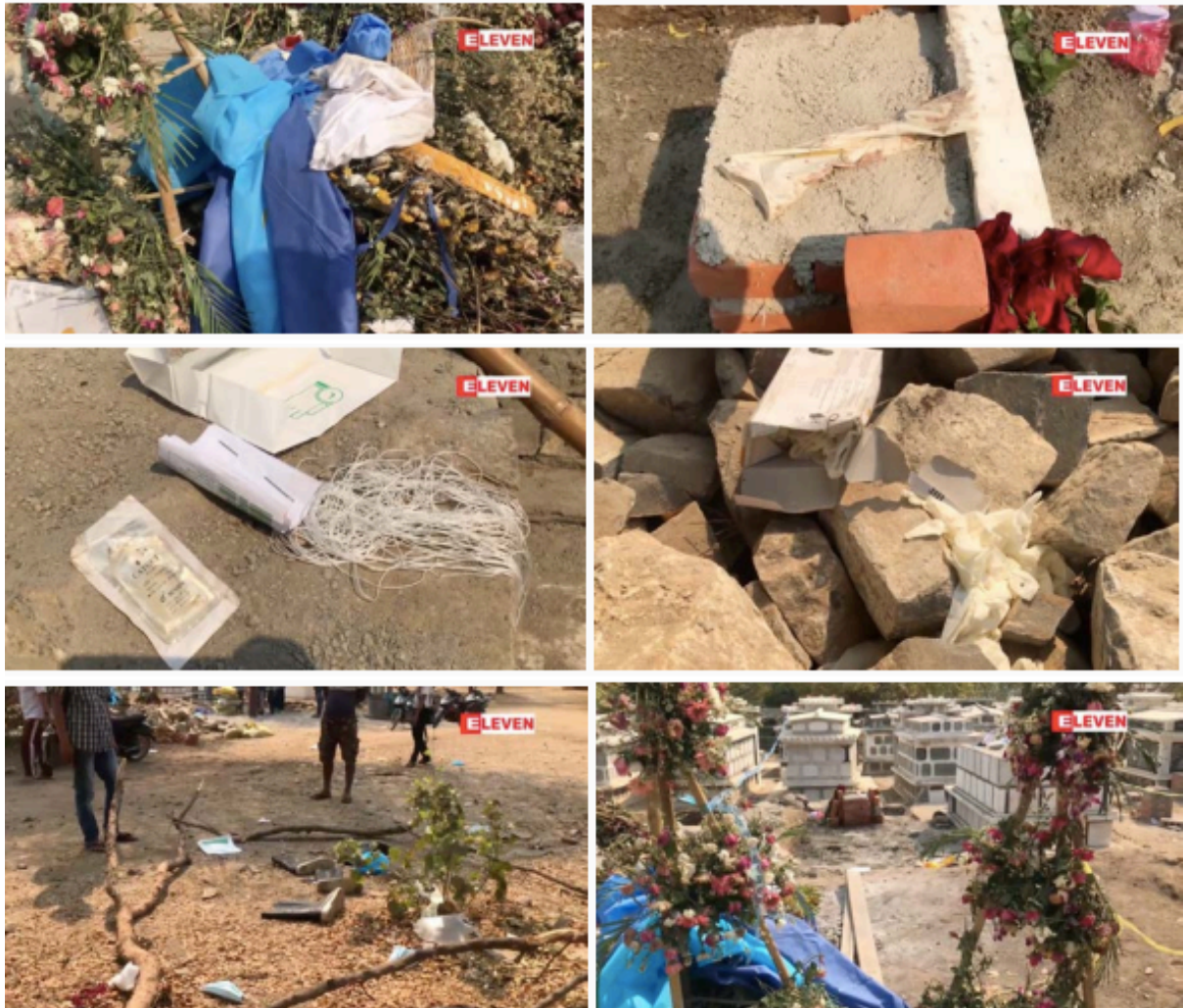
ပုံ 11- ခွဲစိတ်ခန်းသုံးကိရိယာများနှင့် လက်အိတ်များအပါအဝင် သူမ၏အုတ်ဂူကို ဖောက်ထွင်းဝင်ရောက်ပြီးနောက် ကျန်ရစ်ခဲ့သော အထောက်အထားများ