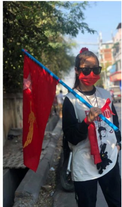
ပုံ 1- အိန်ဂျယ်၏ Facebook အကောင့်မှ ပို့စ်များသည် ဖေဖော်ဝါရီ 1 ရက် 2021 ခုနှစ် အာဏာသိမ်းမှုကို ဆန့်ကျင်ကြောင်းပြသသည်။