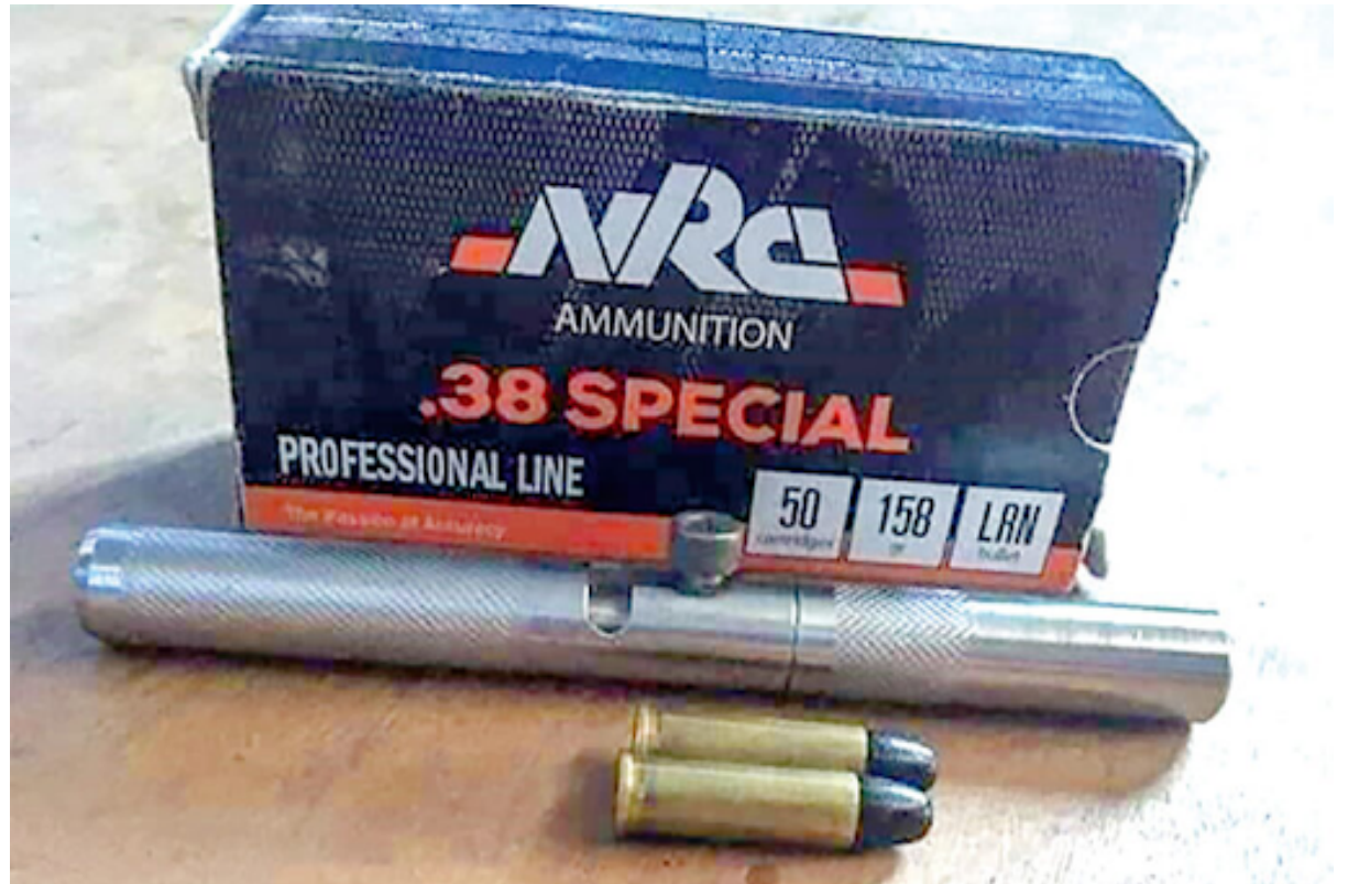
ပုံ 13- အစိုးရသတင်းစာ GNLM မှ ဆောင်းပါးတစ်ခုတွင် အသုံးပြုထားသောပုံသည် အိန်ဂျယ်ကို သတ်ခဲ့သော ကျည်ဆန်အမျိုးအစားကို ပြသထားသည်။

အိန်ဂျယ်သေဆုံးမှုအတွက် ၎င်းတို့နှင့် ပြည်နယ်ရဲတပ်ဖွဲ့တို့၌ တာဝန်မရှိကြောင်း မြန်မာ့အသံနှင့် ရုပ်မြင်သံကြား (MRTV) နှင့် မြဝတီသတင်း (MWD) တို့တွင်တပ်မတော်က ကြေညာခဲ့သည်။ ကျည်ဆန်သည် ရဲများပစ်ခတ်သည့် ကျည်မဟုတ်ကြောင်း ဆုံးဖြတ်ခဲ့ကြောင်း GNLM မှတစ်ဆင့် ကြေငြာခဲ့ပြီး ရဲတပ်ဖွဲ့မှထုတ်ပြန်ချက်တွင် “ဦးခေါင်းတွင် တွေ့ရှိရသည့် ကျည်အပိုင်းသည် ၀.၃၈ မမ ကျည်ဆန်ကိုအသုံးပြု၍ သေနတ်တိုဖြင့် ပစ်ခတ်နိုင်သောကျည်အမျိုးအစားဖြစ်သည်။ (ပုံ ၁၃) တွင်တွေ့ရသောခဲယမ်းများသည် “မြန်မာနိုင်ငံရဲတပ်ဖွဲ့မှအသုံးပြုသည့် အဓိကရုဏ်းနှိမ်နင်းရေး ကျည်ဆန်များနှင့်မတူကွဲပြားသည်” ဟု ထည့်သွင်းဖော်ပြထားသည်။ အိန်ဂျယ်၏ခန္ဓာကိုယ်ကို အုတ်ခဲတစ်ခုအသုံးပြု၍ နှောင့်ယှက်ခြင်းဖြစ်နိုင်ချေတွင် ပစ်ခတ်မှုတွင်အသုံးပြုသည့် ကျည်ဆန် များအပေါ် အဓိကထားဖော်ပြသည့် အခြေအနေနှင့်လည်း တိုက်ဆိုင်နေကာ ၎င်းတို့သည် ထိုကျည် ဆန်ကိုရယူရန်အတွက် သူမ၏ဦးခေါင်းကိုခွဲရန် အုတ်ခဲကိုအသုံးပြုခဲ့ခြင်း၊ အိန်ဂျယ်သေဆုံးမှု အတွက် လုံခြုံရေးတပ်ဖွဲ့ဝင်များက တာဝန်ခံဖို့မရှိကြောင်း ဆုံးဖြတ်သည့်အကြောင်း စသည်တို့ ပါဝင်သည်။