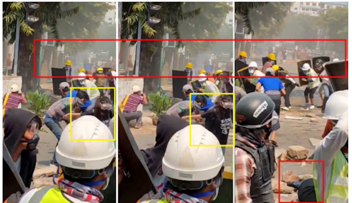
ပုံ 14- ရဲလိုင်း (အနီရောင်) သည် အိန်ဂျယ် (အဝါ)ပါဝင်သော လူအုပ်ကိုပစ်ခတ်သဖြင့် ထိမှန်ပြီးနောက် လဲကျသွားနိုင်သည်။ လဲကျသည့်အခိုက်အတန့်တွင် သူမသည်အဝေးသို့ မျက်နှာမူထားပြီး ထိုအချိန်ကျည်ဆန်ထိမှန်ပါက တရားဝင်ထုတ်ပြန်ချက်များနှင့် ကွဲလွဲနေမည် ဖြစ်သည်။

GNLM ကလည်း "အခင်းဖြစ်ပွားချိန်မှာ တာဝန်ကျတဲ့လုံခြုံရေးအစောင့်တွေက လူစုလူဝေးနဲ့ မျက်နှာချင်းဆိုင်အနေအထားမှာ ရှိနေပြီး သေဆုံးသူက သူမရဲ့နောက်ကျောကနေ ဒဏ်ရာရခဲ့ပါတယ်" ဟု GNLM မှ ပြောကြားခဲ့သည်။ အိန်ဂျယ်ထိခိုက်ခံရသည့် အခိုက်အတန့်ကိုပြသသည်ဟု ယူဆရသည့် Myanmar Witness မှ နေရာသတ်မှတ်ထားသော ဗီဒီယိုဖိုင်တွင် သေနတ်သံများ ကြားရသောကြောင့် ရဲများဘက်မှ အိန်ဂျယ်ထွက်ပြေးသွားသည်ကို သရုပ်ပြထားသည်။ 21.977227, 96.077500 ဝန်းကျင်တွင် သူမ၏ဦးခေါင်းနောက်က ရဲများဘက်တွင်ရှိကာ ရဲများနှင့်ဝေးရာထွက်ပြေးရင်း မြေပြင်ပေါ်သို့လဲကျသွားသည်ကို မြင်တွေ့ရသည်။ အိန်ဂျယ်သည် ဗီဒီယိုဖိုင်မှာပါတဲ့ လဲကျမှုသည် အုတ်ခဲတွေကိုနင်းမိလို့ လဲကျသွားခြင်း ဖြစ်နိုင်သောကြောင့် ဤဗီဒီယိုဖိုင်တွင် အပစ်ခံရကြောင်း Myanmar Witness က အတည်မပြုနိုင်သေးပေ။