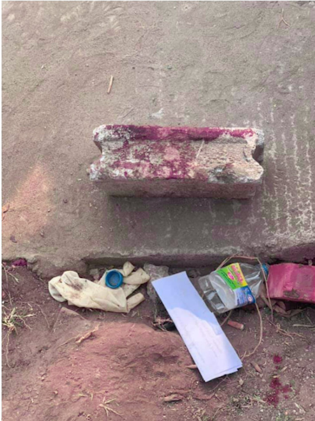
ပုံ 12- (ဘယ်ဘက်) မူရင်းဓာတ်ပုံ (ညာဘက်) အိန်ဂျယ်ရဲ့ အုတ်ဂူဘေးမှာ သွေးစွန်းထင်းနေတဲ့ မြေပြင်နှင့် အုတ်ခဲကို မီးမောင်းထိုးပြရန် ပန်းခရမ်းရောင်ဖြင့်ပြထားသောဓာတ်ပုံ။ အုတ်ခဲအစွန်းတွင် တွေ့ရသော ထင်ရှားသောသွေးကွက်များသည် ထိခိုက်မှုမှဖြစ်နိုင်သည်။ ယင်းအုတ်ခဲများကို အိန်ဂျယ်၏ ဦးခေါင်းခွံကိုဖွင့်ရန် အသုံးပြုခြင်း ဖြစ်နိုင်သည်။ ခွဲစိတ်လက်အိတ်ကိုလည်း တွေ့ရသည်။