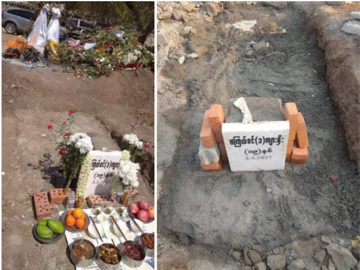
ပုံ 15: သူမ၏သေဆုံးသည့်ရက်စွဲနှင့် အမည်နှင့်အတူ Angel ၏အုတ်ဂူ။