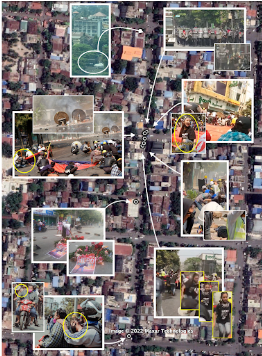
ပုံ 3 သည် Angel နှင့်ပတ်သက်သော အသုံးပြုသူဖန်တီးထားသော အကြောင်းအရာများ၏ တည်နေရာ သတ်မှတ်ခြင်းကို ပြုလုပ်ထားခြင်း