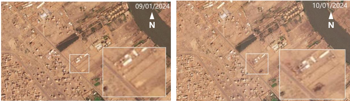
الشكل ٤: صور القمر الصناعي التابعة لبلانيت تظهر الأضرار التي لحقت بالمنطقة الأمامية لمنشأة اليونسيف. المصدر: بلانيت (التوضيحات:

وأكدت صور القمر الصناعي بلانيت أيضا أن الضرر الذي لحق بالمنشأة والمناطق المحيطة بها ظهر لأول مرة في الفترة ما بين ٩ و ١٠ يناير، حيث ظهرت بقعا داكنة على الأرض حول البوابة الغربية والمباني داخل الموقع (الشكل ٤).