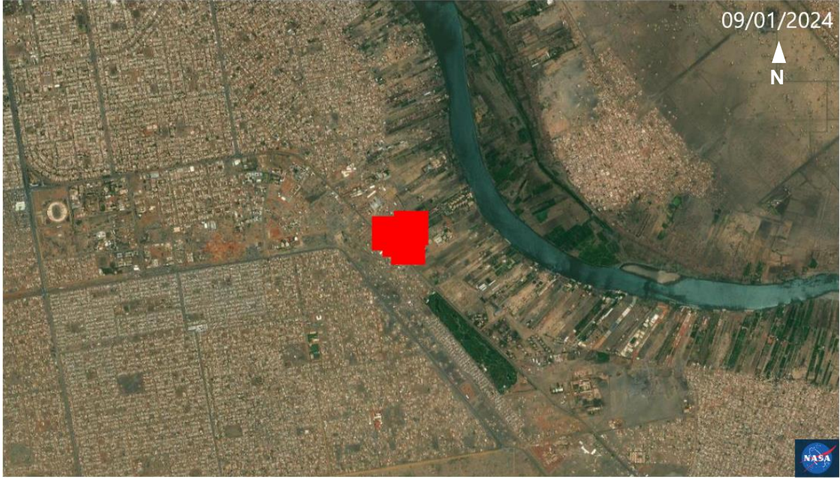
الشكل ٣: بيانات ناسا فيرمس تظهر ٤ إشارات حرارية فوق منشأة اليونسيف في سوبا، الخرطوم.

وأكدت صور القمر الصناعي بلانيت أيضا أن الضرر الذي لحق بالمنشأة والمناطق المحيطة بها ظهر لأول مرة في الفترة ما بين ٩ و ١٠ يناير، حيث ظهرت بقعا داكنة على الأرض حول البوابة الغربية والمباني داخل الموقع (الشكل ٤).