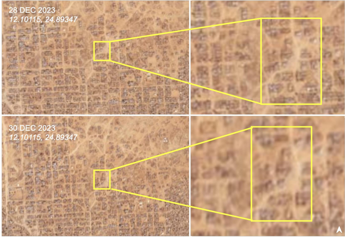
الشكل ٤: صور الأقمار الصناعية تظهر الأضرار المحتملة الناجمة عن الغارات الجوية في حي الرياض، نبالا، في الفترة ما بين ٢٨ و ٣٠ ديسمبر ٢٠٢٣. (التوضيحات: مركز صمود المعلومات)

وجاء في تعليق الفيديو الثاني أن عائلة مكونة من سبعة أطفال وثلاث نساء قُتلوا في غارة جوية في حي نبالا بالرياض. ولاحظ فريق شاهد السودان وقوع ما لا يقل عن ١٢ ضحية في لقطات تتعلق بآثار الغارات الجوية، بما في ذلك النساء والأطفال.